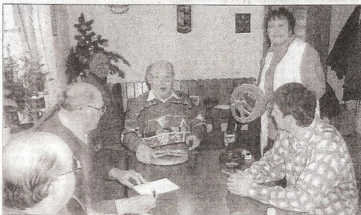
Um die Brezeln der Sonnen-Wirtin wird alle Jahre in der Eppinger Gaststätte gewürfelt.

Eppingen. (ai) Der Brauch, am Silvester-nachmittag um eine Brezel zu würfeln, hat im Gasthaus „Sonne“ in der Adelshofener Straße in Eppingen eine lange Tradition. Es ist dies aber auch einer der wenigen Orte, wo dieser Brauch heute noch in Eppingen gepflegt wird.